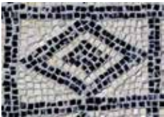
Rimska vila u Valbandonu Roman villa at Valbandon La villa Romana a Valbandon Römische Villa in Valbandon