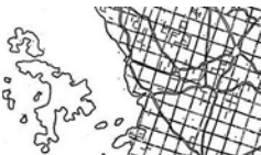
Rimska centurijacija Roman centuriation La cenuriazione romana Römische Centuriation