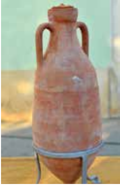
Tvornica amfora u Fažani Amphora production plant in Fažana La fabbrica di anfore a Fasana Amphorenfabrik (Amphorenherstellung) in Fažana

Fažana war wegen seiner natürlichen geographischen Lage, der Nähe des Meeres und der fruchtbaren Felder mit mediterranen Kulturen ein wichtiges wirtschaftliches Zentrum der römischen Zivilisation.