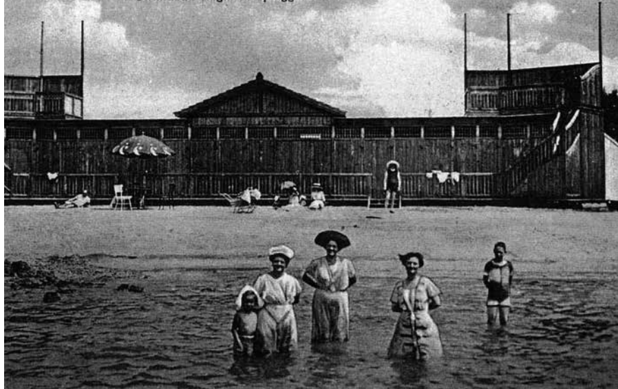
Val Bandon Strandbad Bagni di spiaggia